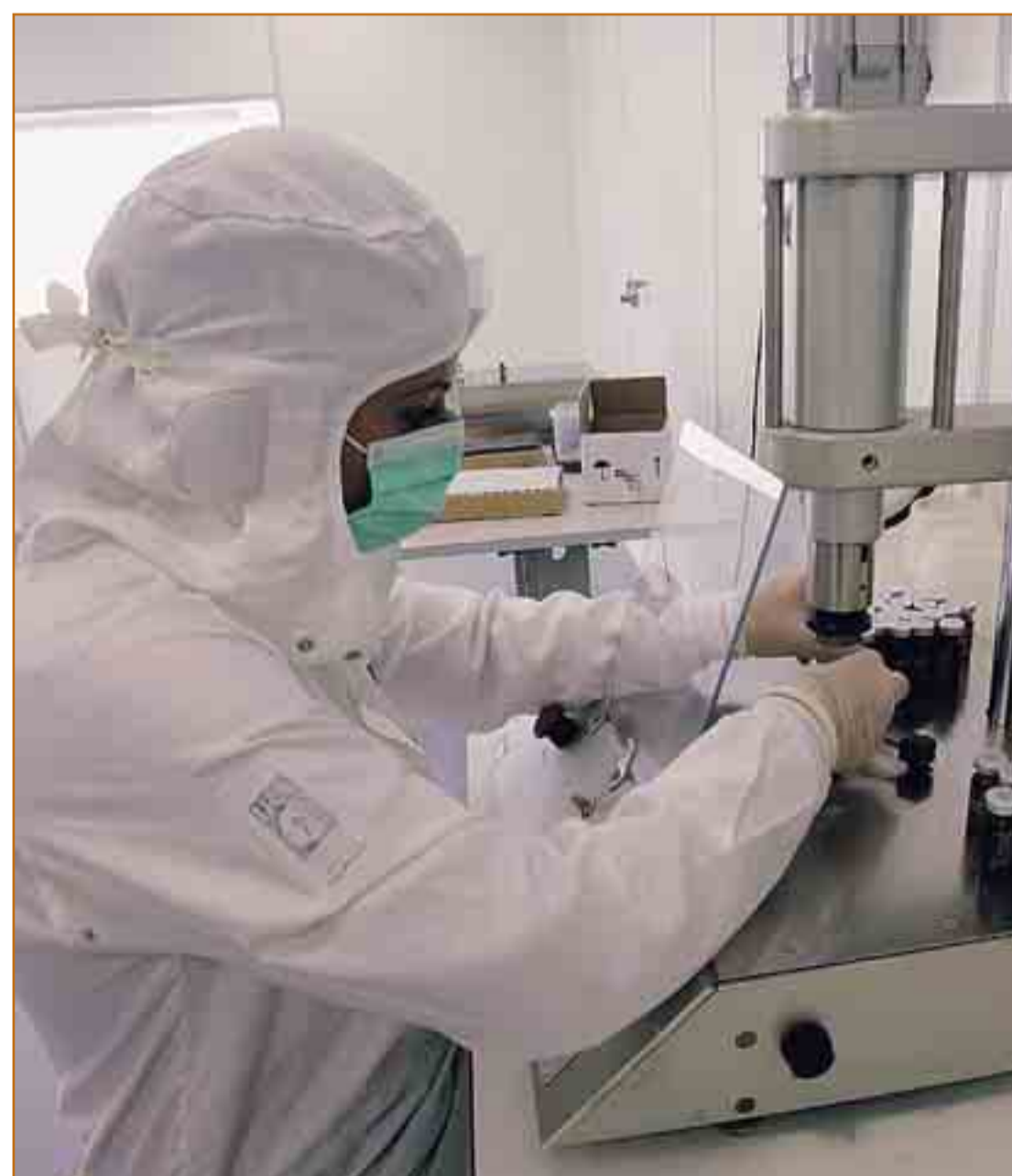
Nella foto al centro e qui sopra due immagini dell'Istituto di ricerche applicate

il Cittadino in collaborazione con la Camera di Commercio Monza e Brianza