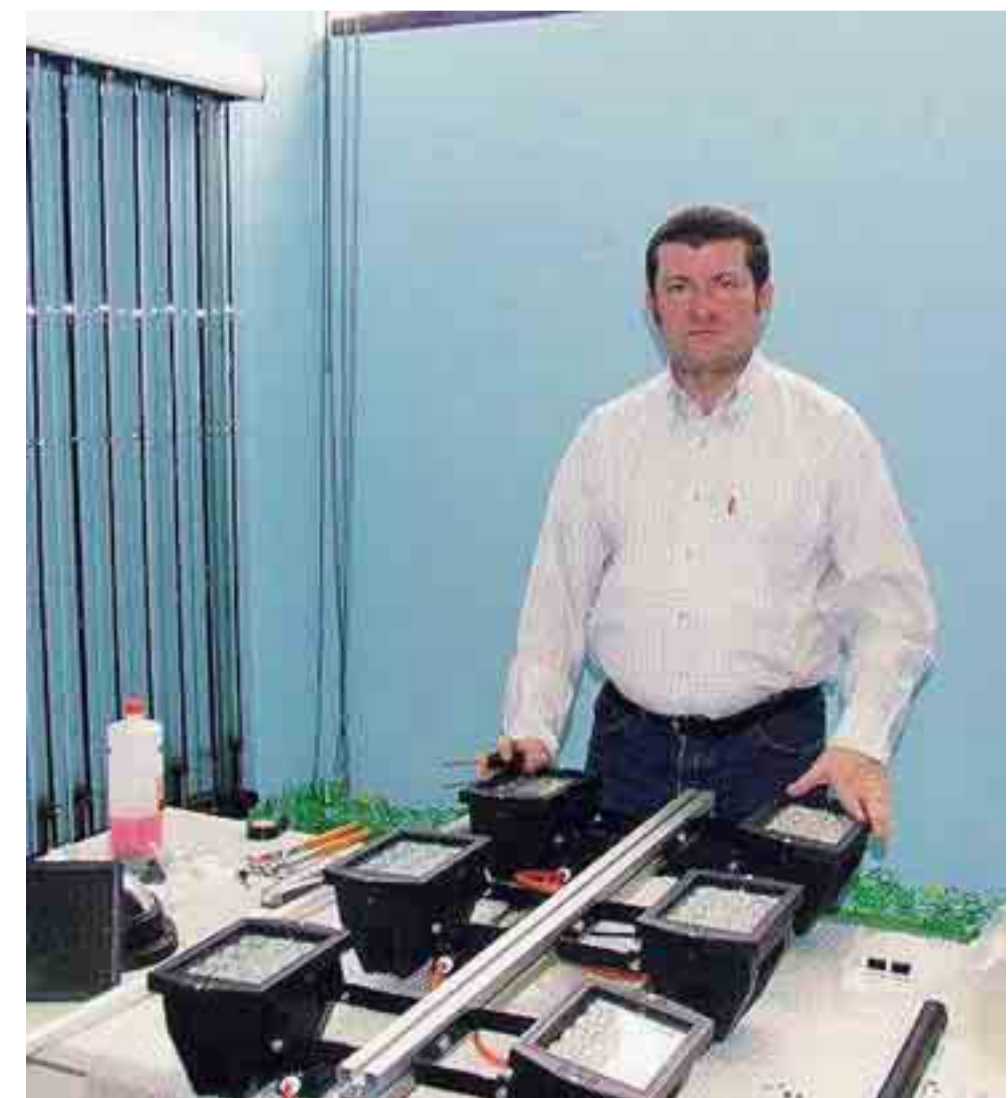
Il laboratorio dell'Angiola Technology